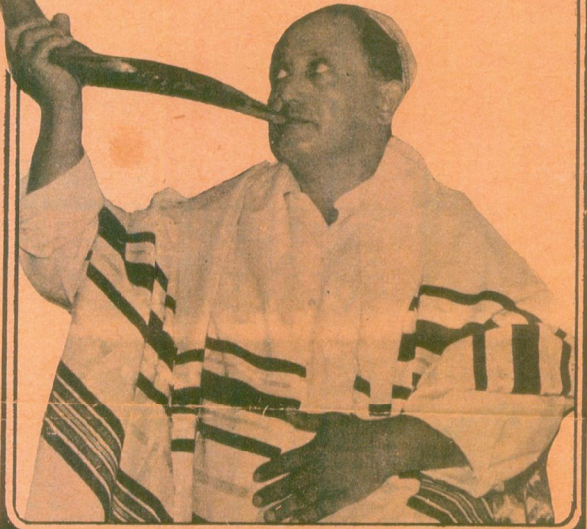
„בכל פעם שאני מסיים יצירת שופר, אני חש סיפוק עצום. וכשאני מפיק ממנו צליל נקי וערב, אני חושב: מי יודע, אולי שופר זה יבשר את בוא המלך המשיח?“