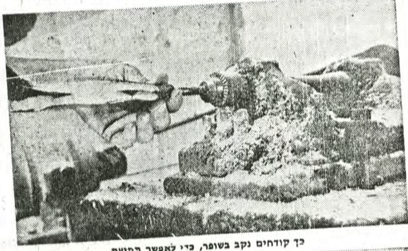
כך קודחים נקב בשופר, כדי לאפשר הקיעה

מתורכיה השנה, כי הרכבת חדלה לנוע בין תורכיה לתחנה הישנה ביפו, ואילו קו אניות סדיר טרם קם. גם קרני הא"י לים, כך הגיעה שמועה לאזניו, שוב אינן באותה איכות. גבוהה כפי שהיו לפני עשרים ושלושים שנה, בלידת ברירה החל מתכתב עם סוחרים בספרד ואף באוסטרליה הרחוקה. מדבריהם למד כי יש בכוחם לספק לו את הקרניים המבוקשות, ובמחיר זול יחסית.